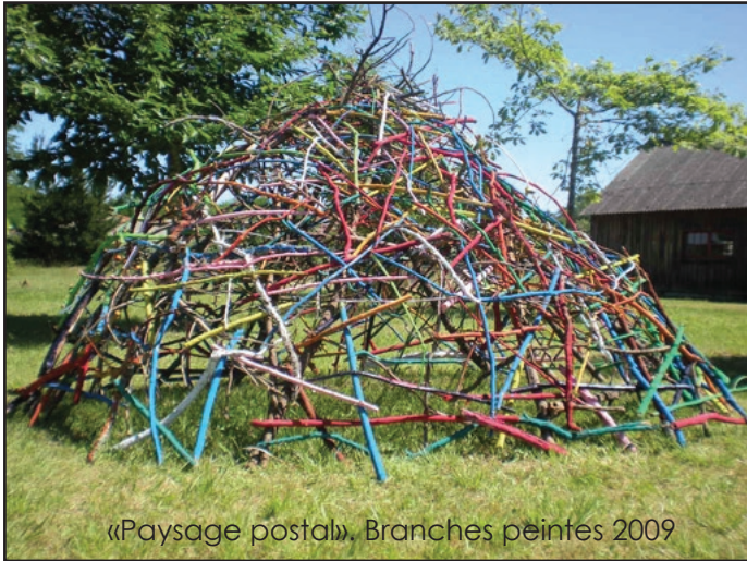
«Paysage postal». Branches peintes 2009