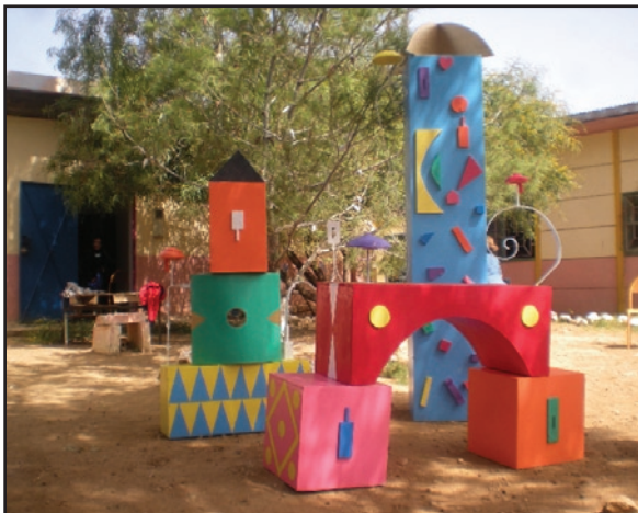
Installation Baboum créée en résidence pour une école de la province de Elhajeb