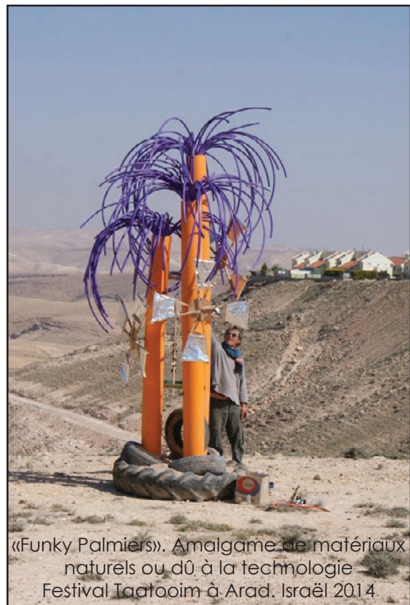
«Funky Palmiers». Amalgame de matériaux naturels ou dû à la technologie Festival Taatooim à Arad, Israël 2014