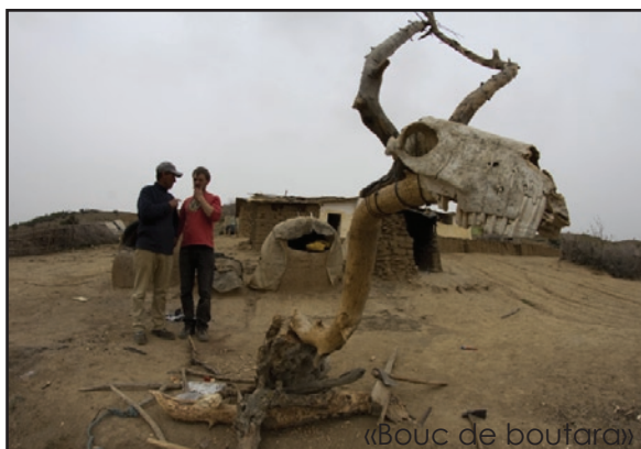
«Bouc de boufara»