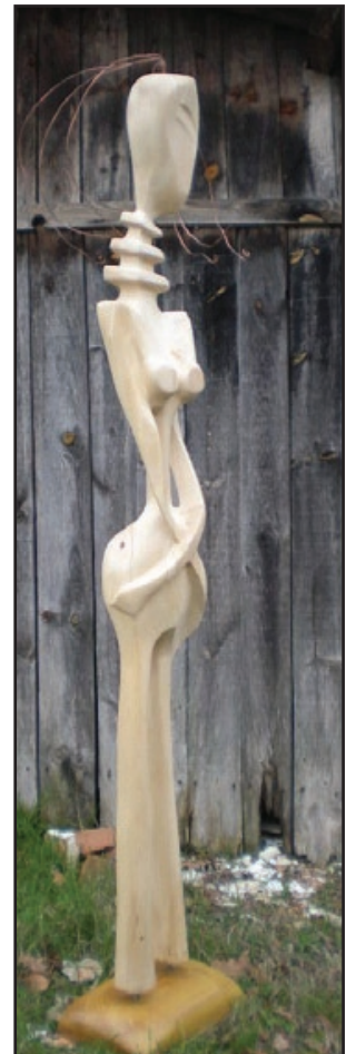
«Femme girafe». Tilleul 2009