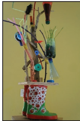
«Jardin suspendu» 2011