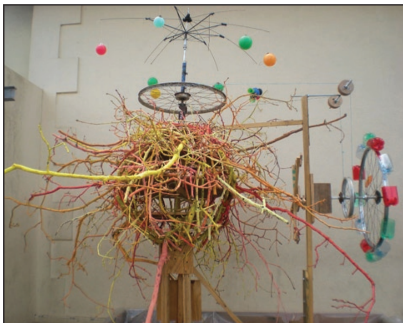
«Système solaire». Atelier scolaire. Parentis 2010