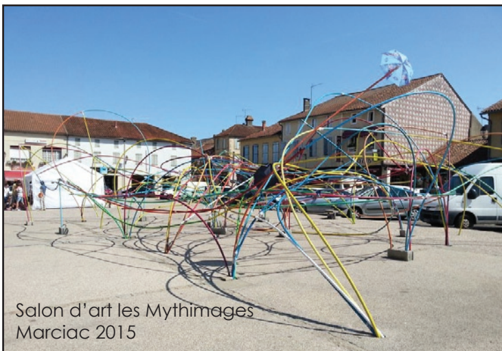
Salon d'art les Mythimages Marcillac 2015