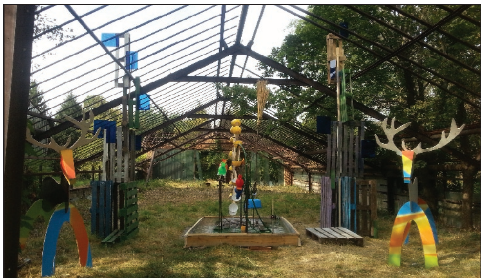
Installation cinétique. Jardin botanique d'Almaty Artbat festival. Kazakhstan 2016 Lien video :

https://www.youtube.com/watch?v=QyZncTJyufk&index=2&list=PLQoJVvNCInuDAUG6UaTxODVowkTeaUom8