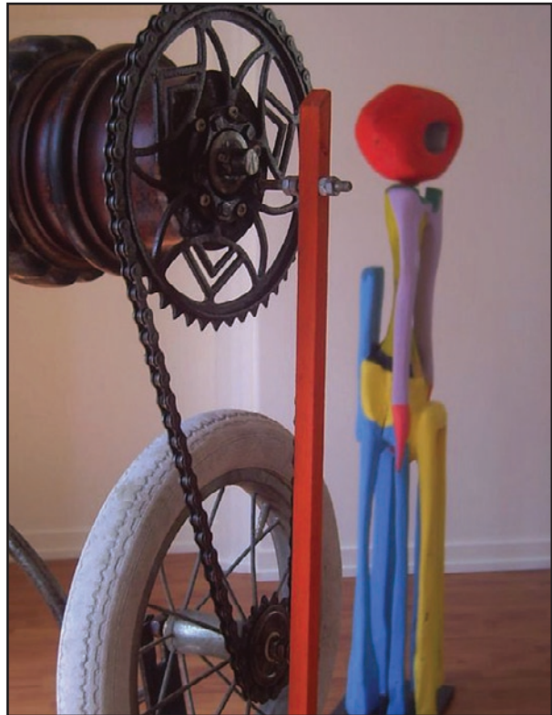
Sculpture cinétique et the boy Bois acrylique 2013