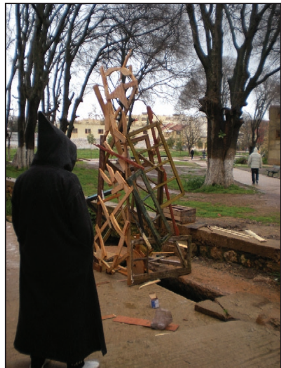
«Tour menuise». Installation cinétique Province de El Hajeb