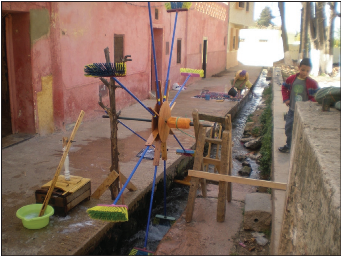
«Machine Madame Propre». Amalgame de matériaux naturels ou dû à la technologie Province de El Hajeb. Maroc 2013