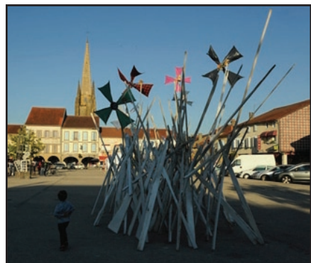
Sculptures géantes en mouvement perpétuel, composées d'un amalgame de matériaux naturels ou pas. Invité d'honneur au Salon d'art les Mythimages. Marciac 2015