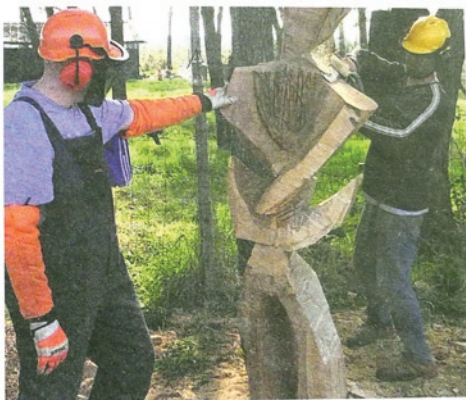
Un binôme au travail.

Les heures de plusieurs semaines ont été bloquées sur plusieurs jours d'affilée. Organisés en binômes (un élève de BTS avec un apprenti du