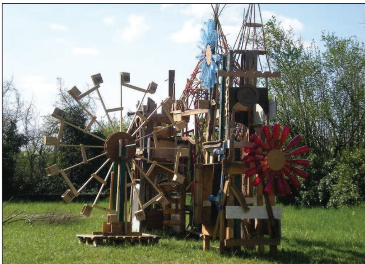
«Chateau des contes». Amalgame de matériaux naturels ou dû à la technologie Ecole de Saint-Macaire 2010