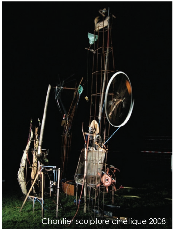
Chantier sculpture cinétique 2008