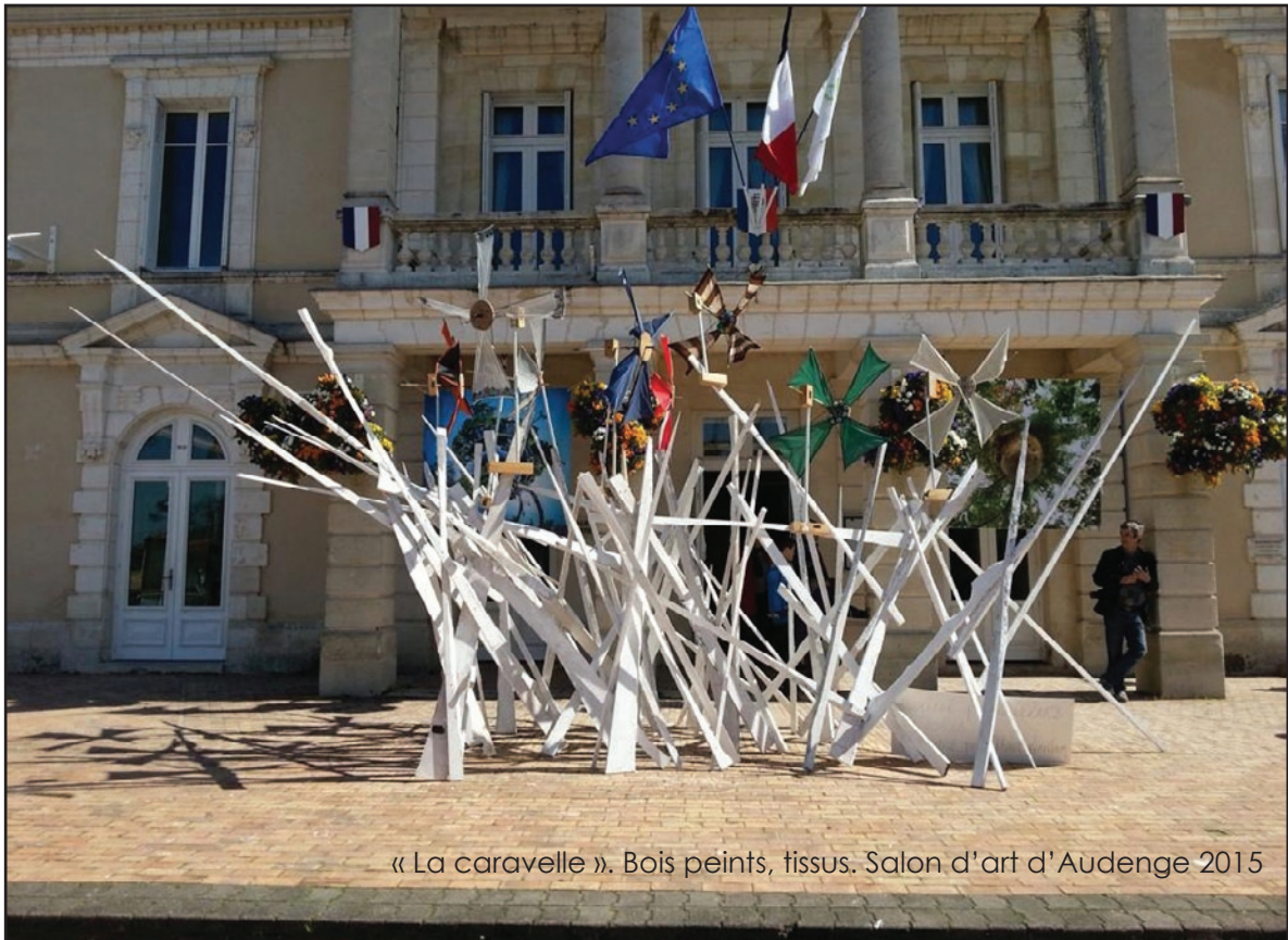
« La caravelle ». Bois peints, tissu. Salon d'art d'Audenge 2015