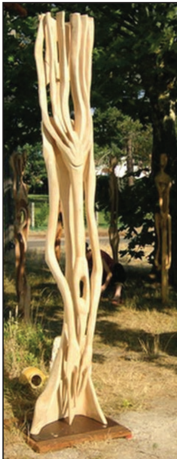
«Arbressence». Tilleul 2005