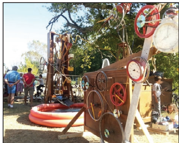
Sculpture composées d'un amalgame de matériaux naturels ou dû à la technologie Ressorcerie Repeyre Festival Eaudyséee. Mios 2014