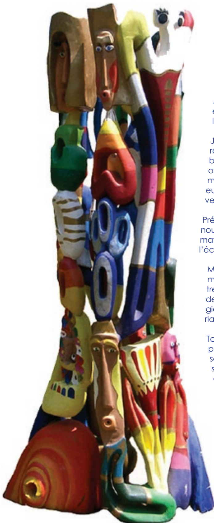
«Le Jardin des marguerites» - Tilleul, acrylique 220 x 80 x 80 cm