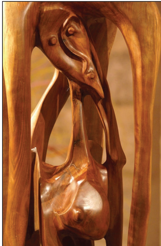
«Zaza». Détail. Noyer 2010