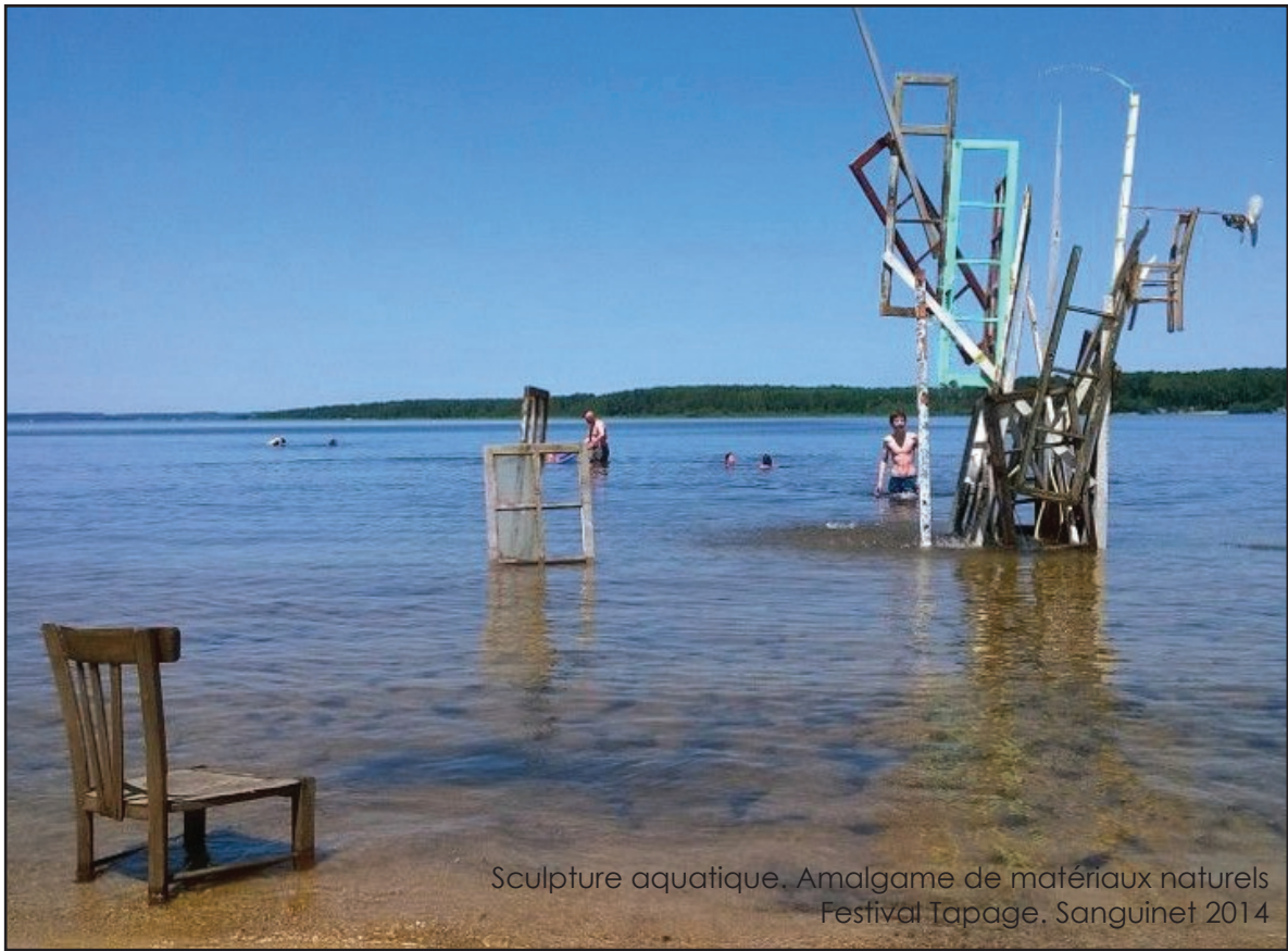
Sculpture aquatique. Amalgame de matériaux naturels Festival Tapage. Sanguinet 2014