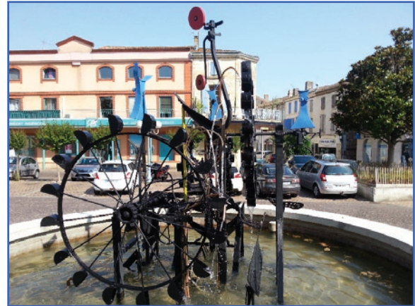
Installation cinétique «La Fontaine aux trois vaches» Tonneins. Parcours artistiques Artère 2017 (47) Lien video : http://www.dailymotion.com/video/x5pt6iu