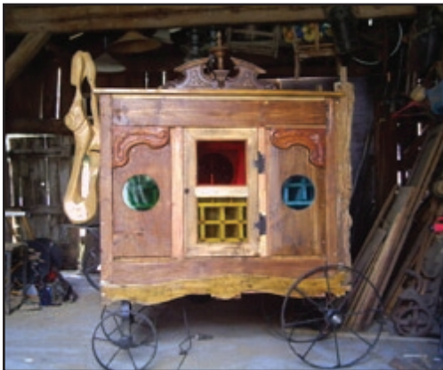
«La roulotte» 2013 Commande des foyers ruraux