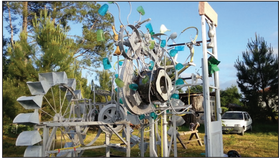
«Salade d'escargots» sculpture aqua-cinétique - 2018 Lien video : https://www.youtube.com/watch?v=j8mxe6lxI4Y