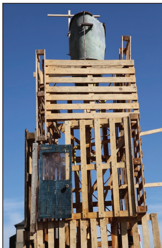
Sculpture aqua-sonore «Flux et reflux». Festival Aureilh'en son. Aureilhan 2016