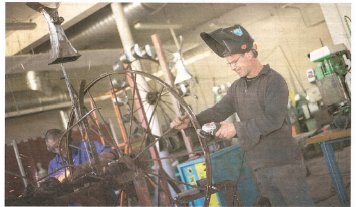
L'artiste landais Olivier Louloum

À Clairac, les élèves du lycée agricole et technique ont été mis à contribution pour créer « La Fontaine aux trois vaches », d'Olivier Louloum. « L'idée était de récupérer de vieilles machines agricoles, de les démonter et d'en faire une sculpture-fontaine mais dans un esprit agricole. » Les roues des charmes devinrent ainsi des moulins à eau qui, en tournant, activent des mécanismes, notamment trois têtes de vache. « C'est une structure cinématique. Une référence aux machines spectacle de Jean Tinguely. Je me suis amusé à faire un parallèle avec les Trois-Grâces de Bordeaux, la sculpture-fontaine sur les quais », ajoute l'artiste landais. Cette étonnante installation fait partie d'une série de 11 œuvres exposées jusqu'au 30 septembre dans 11 villages du pays Val de Garonne-Guyenne-Gascogne. Un projet dont l'archéologie a été confiée à Christophe Doucet, autre grand artiste plasticien, à qui l'on doit notamment la Forêt d'art contemporain dans le Parc naturel régional des Landes.