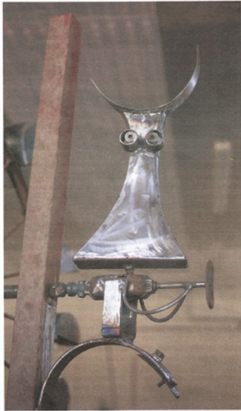
Une des trois vaches de la fontaine d'Olivier Louloum